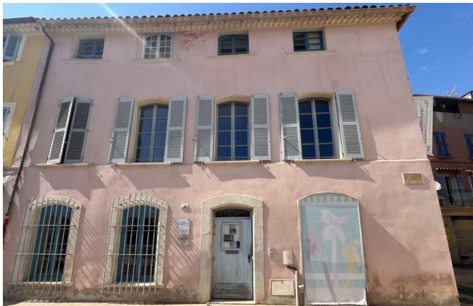
Une maison de maître du XVIIIème à La Seyne-sur-Mer en plein cœur du centre historique, Place Martel Esprit.