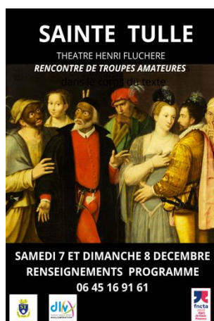
Le vilain Mire, fantaisie médiévale

Et surtout, échange de bons procédés, et donnant-donnant, entre compagnies des autres Comités, ce que nous faisons personnellement, avec plusieurs troupes du Var et du 13.