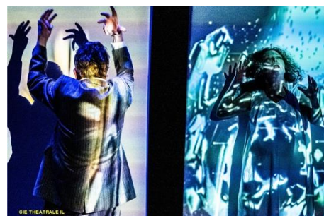
Richard III n'aura pas lieu

Les 29 et 30 novembre 2024, la Grande finale du Masque d'Or aura lieu au Casino Grand cercle d'Aix-les-Bains, Le Masque d'Or est un concours national organisé tous les quatre ans par la FNCTA dont les présélections en deux temps se déroulent sur une année. A l'issue de cette phase de présélection, un jury de professionnels décerne le trophée du Masque d'Or à l'équipe du meilleur spectacle et un jury de lycéens et étudiants attribue le Prix du Jury Jeunes.