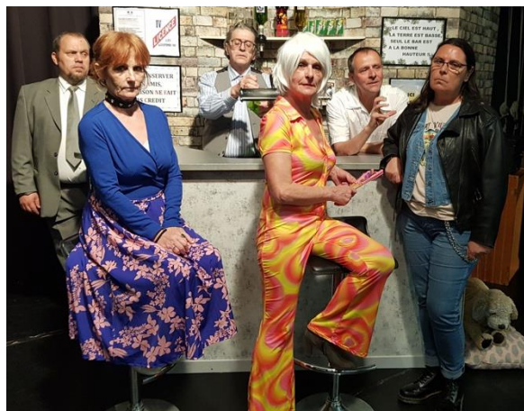
Ci-dessus Un air de famille d'Agnès Jaoui et Jean-Pierre Bacri à droite La chaise de paille de Sue Glover

La Compagnie de Caramentran est aussi, et surtout, l'organisatrice du plus grand festival de Théâtre amateur des Bouches du Rhône (entre 10 et 12 soirées d'affilée), les ESTIVADES des ROQUILLES qui ont fêté leurs 30 ans d'existence en 2024 (au lieu de 31 à cause du Covid), où est faite la part belle aux Compagnies présentes au «OFF» d'Avignon et aux Compagnies fédérées régionales. Au cours des années, ce festival a pris une ampleur nationale et le site s'est peu à peu transformé en espace dédié à la création théâtrale, bénéficiant de matériels, d'équipements et d'un aménagement performant.