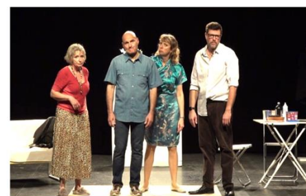
16h: « Non à l'Argent » de Flavia Coste par la compagnie Jeu d'Artifices (06)