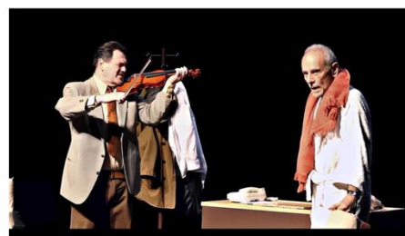
14h: « Fausse Note » de Didier Caron par la compagnie Nouvel Acte (13)

Dimanche 9 mars 2025 REGION SUD Salle Le Tempo à Gap PROVENCE ALPES CÔTE D'AZUR La Fédération Nationale des Compagnies de Théâtre Amateur, Union Régionale SUD EST, présente le Grand Prix annuel