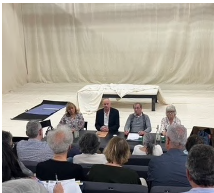
L'AG dans le Petit théâtre de la Colline

Présidente de la région Ile de France pendant 17 ans, elle y crée 5 comités départementaux et contribue au partenariat avec la MPAA (Maison des pratiques amateurs), notamment avec Singulière Rencontre qui met en avant des auteurs contemporains. En 2015, elle est élue au conseil d'administration fédéral où elle assure la fonction de Vice-Présidente à l'Action jeunes, participant activement à la pérennisation d'EDERED et d'InterKultour. Elle a également participé à de nombreux jury et anime la journée des élus.