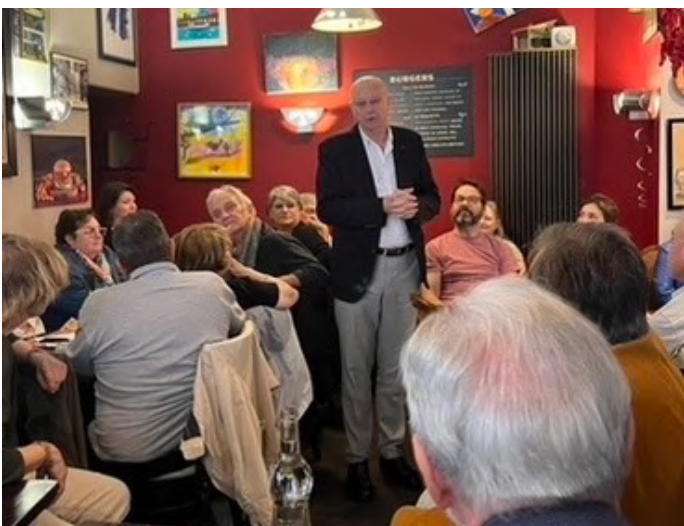
Un diner, sous le signe de la convivialité et de l'échange ponctué de discours chaleureux

Extrait de l'interview réalisée par la FNCTA (Sources FNCTA)