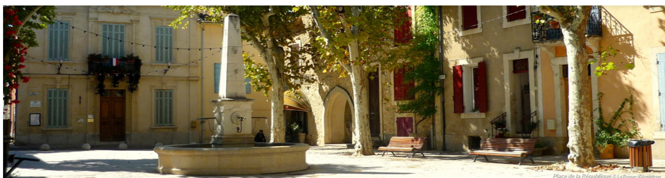
LA ROQUE D'ANTHÉRON

Cette inter-régionale revêt un caractère particulier puisque deux années de suite ce sont des troupes de Var qui ont remporté le Grand prix ; en 2023, la Compagnie IL de la Garde, avec Richard III n'aura pas lieu de Matei Visniec et cette année, la Compagnie Anagram de Carqueiranne avec Huit femmes de Robert Thomas.